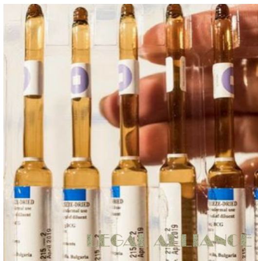
Госслекслужба будет осуществлять проверки в 2018 году