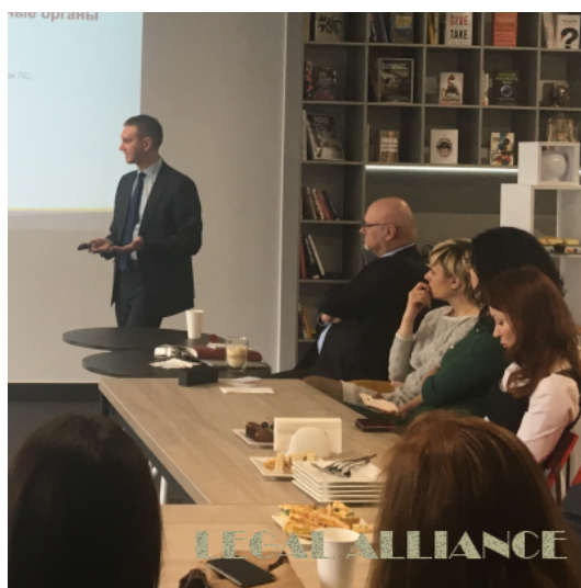
Юристы Правового Альянса рассказали об эффективных методах противодействия кризисным ситуациям в фармкомпаниях