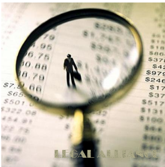
Снят мораторий на проверки АМКУ